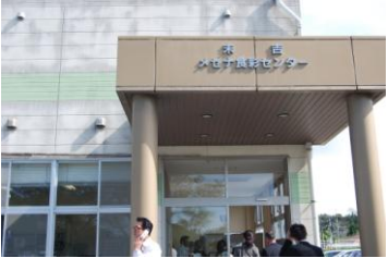
メセナ食彩センター