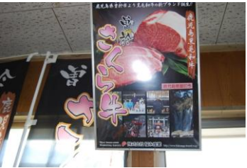
JA ぞお鹿児島肥育センター3