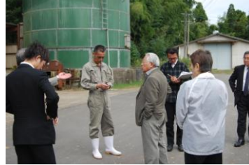
JA ぞお鹿児島肥育センター1