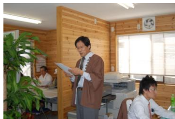
曾於市観光特産開発センター2