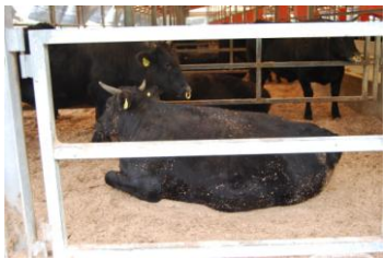
JA ぞお鹿児島肥育センター2