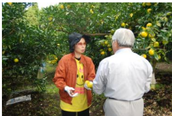
西留農園 (柚園) 1