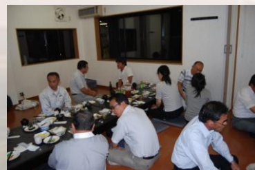
夕食・意見交換会 2