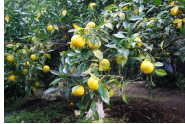
西留農園 (柚園) 1