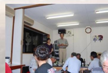
夕食・意見交換会 1