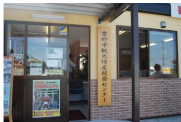
曾於市観光特産開発センター1